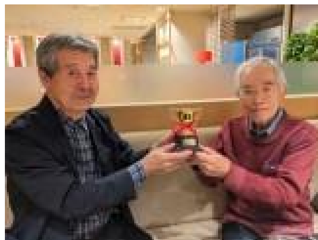
令和5年10月度 熱戦～表彰式