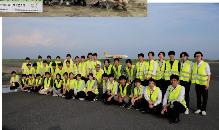
<R5.9 関東地方 学生見学会（関東研修）>