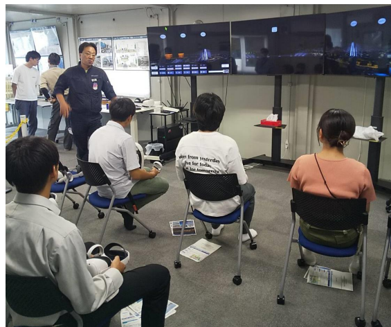
川崎港 臨港道路整備事業