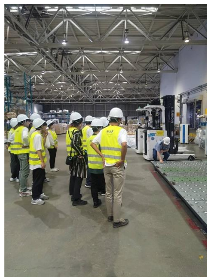
羽田空港第二国際貨物ビル