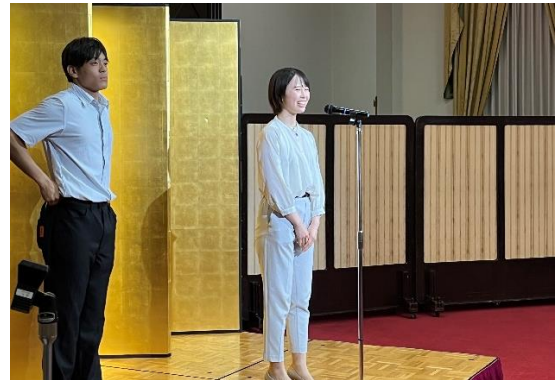
臨時総会（学士会館）