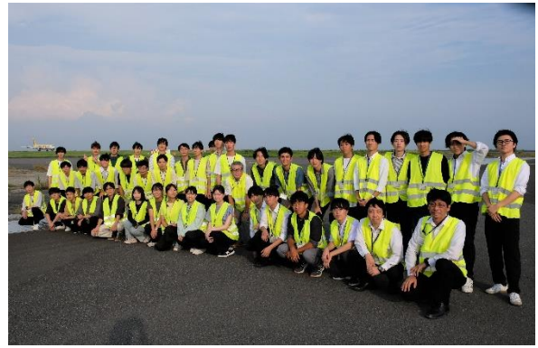
羽田空港管理用棧橋（D滑走路）